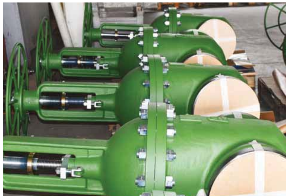
Inovované lité šoupatko S38 pro JE Akkuyu v Turecku.

V 80. letech minulého století společnost patřila ke koncernu VHJ SIGMA a po jeho privatizaci v roce 1992 vznikla soukromá spo-