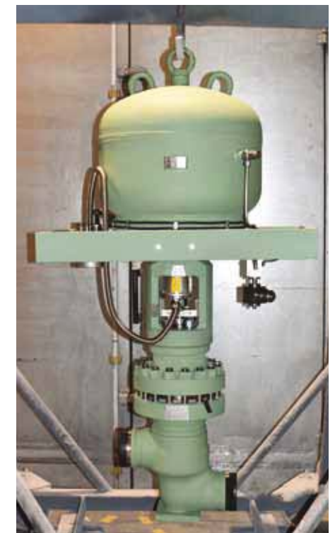
Rychločinný vlnovcový ventil A13 pro JE Rooppur v Bangladěši.

několik let dopředu. Aktuální situace ve světě není optimální, přesto oceňuji obnovenou přímou komunikaci s našimi partnery a zákazníky a dále usilovně pracujeme na všech pilotních projektech dodávek pro jaderné elektrárny Rooppur v Bangladěši, Kudankulam v Indii a Akkuyu v Turecku,“ dodává.