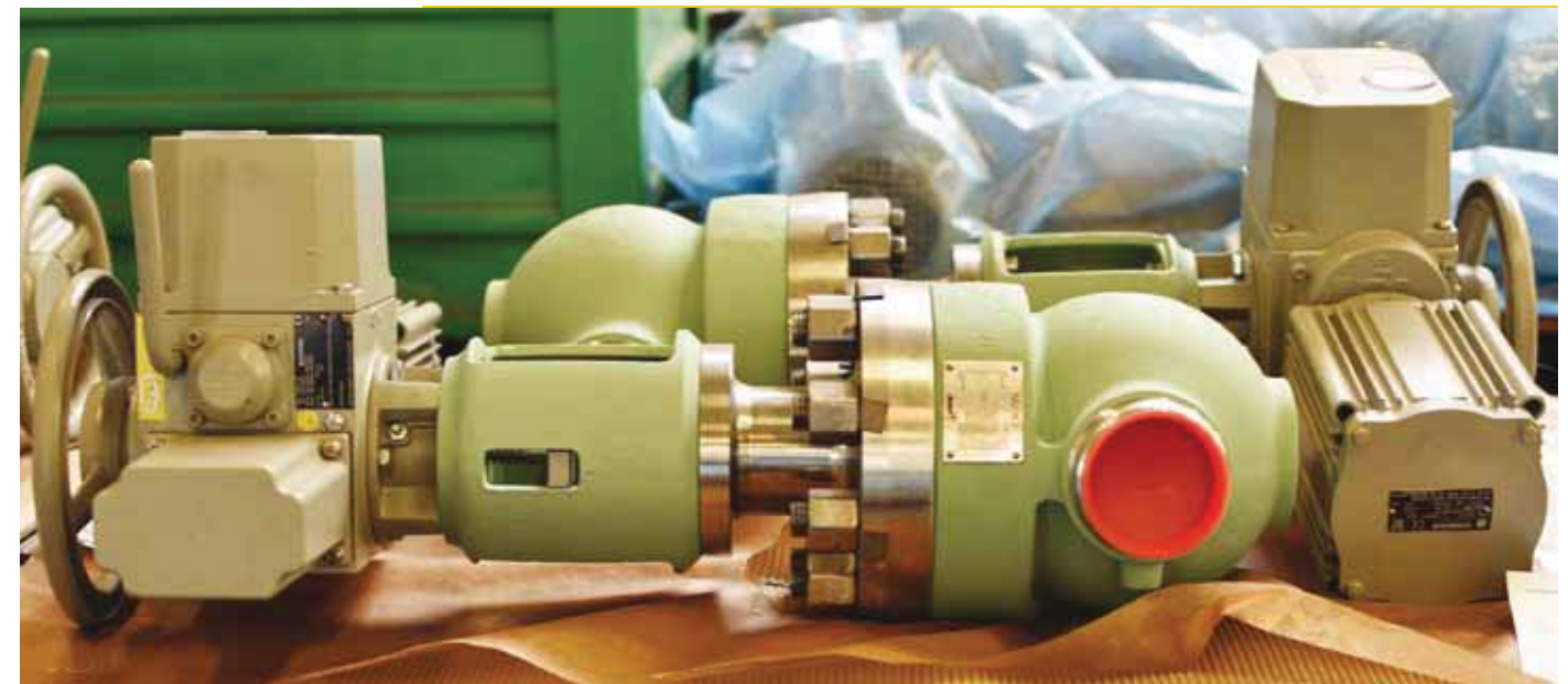
Regulační ventil OK-GCV pro JE Kudankulam v Indii.

lečnost ARAKO spol. s r.o. Od té doby ARAKO prošlo mnoha inovacemi a rozšířením výroby, což se také podepsalo na rozšiřující se nabídce portfolia armatur i služeb. Zaměstnává přibližně 200 pracovníků a v dnešní době expeduje do 25 zemí světa. Propojuje individuální potřeby klientů z průmyslových oborů, vyrábí armatury odpovídající požadavkům na spolehlivost a bezpečnost. „Jedinečnost našich výrobků vidíme ve schopnosti přizpůsobit se širokému množství specifických požadavků jednotlivých projektů. Nemusíme vždy něco nového vytvářet takřka od nuly. Často dokážeme na nové požadavky rychle reagovat přizpůsobením našeho stávajícího výrobního programu,“ říká Julie Dolguševa, výkonná ředitelka společnosti ARAKO.