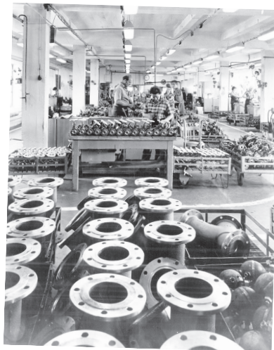
HISTORICKÝ snímek z výrobního programu Sigmy Opava.