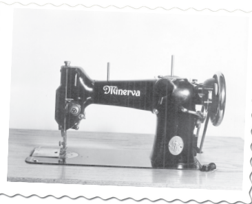
MINERVA své šicí stroje exportovala i do zahraničí.

Pokud se v historii dostaneme zhruba na přelom 19. a 20. století, zjistíme, že předchůdce dnešní firmy ARAKO, tedy společnost Minerva, se původně zabíral úplně jinou výrobou. A sice vyráběl šicí stroje. Ve svém oboru patřil ke špičkám. Během roku 1928 jich továrna dokázala vyprodukovat 45 tisíc kusů. Obě světové války sice výrobu výrazně přibrzdily, ale podnik se z toho vždy dokázal vzpamatovat a vydatně exportoval do zahraničí. V roce 1953 tehdejší Minerva prošla významnou přestavbou. Produkce šicích strojů klesla na 30 procent a začaly se zde vyrábět průmyslové armatury. Sortiment se v dalších letech rozšiřoval a výrobky mířily nejen do tuzemských elektráren, tepláren nebo chemických a potravinářských závodů, ale dováželo se i za naše hranice, hlavně do Sovětského svazu. Minerva později spadala pod Moravskoslezskou armaturku Dolní Benešov, respektive koncern SIGMA. Důležitým mezníkem se stal 26. červem 1992. Tehdy došlo k založení firmy ARAKO, která pod stejným názvem v areálu ve Hvězdoslavově ulici funguje dosud. Brzy si tak připomene významné 25. výročí svého vzniku.